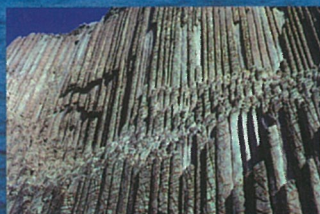
Los Organos LA GOMERA