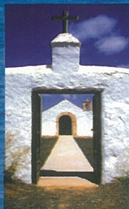
Ermida de San Isidro Triquivijate FUERTEVENTURA