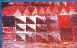
Detalle del panel central de la Cueva Pintada de Gaidar GRAN CANARIA