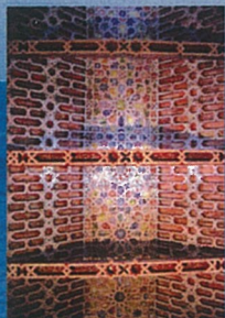
Teachumbre de la Iglesia del Salvador, S/C de La Palma LA PALMA