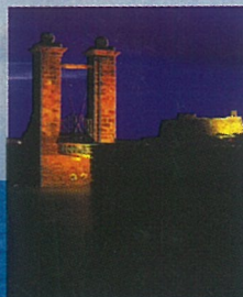
Puente de las Bóvedas, Arrecife LANZAROTE