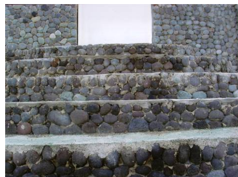
Sucesión creciente petrificada Javier Padilla Travieso