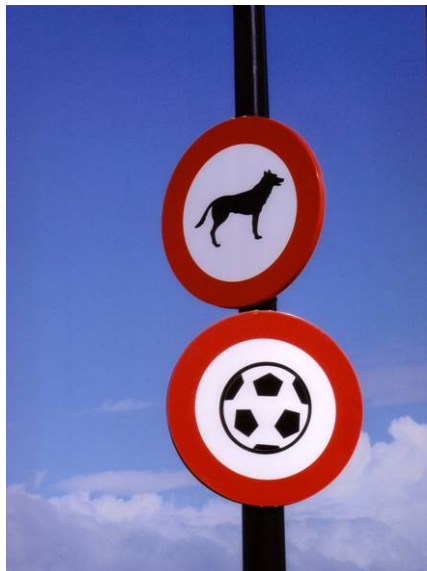
¡¡¡Guau!!! Prohíben el círculo y los pentágonos. Elena Rivero de Mesa