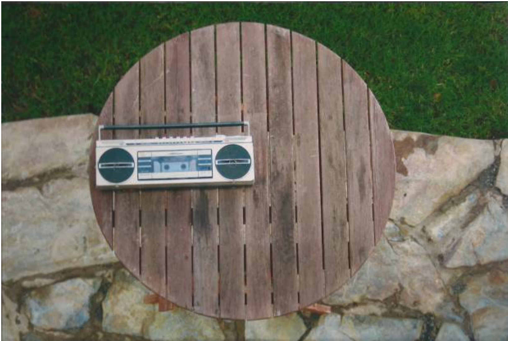
“El radio de la circunferencia” Autor: Jake Allen. Colegio Luther King Sur. Tenerife.