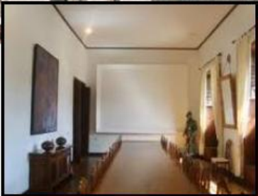
PALACIO SPÍNOLA. Salón plenario.