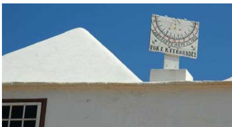
Iglesia parroquial de Tinajo. Lanzarote