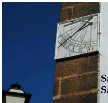
Santuario de Ntra. Sra. de Las Nieves. Santa Cruz de la Palma

Santa Cruz de Tenerife, 1 de junio de 2007